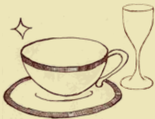
● ブランド食器・グラス