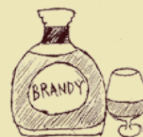
● 洋酒・ブランデー