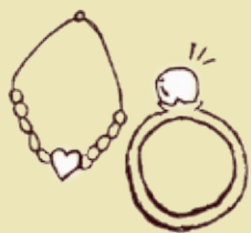
● 貴金属・アクセサリー