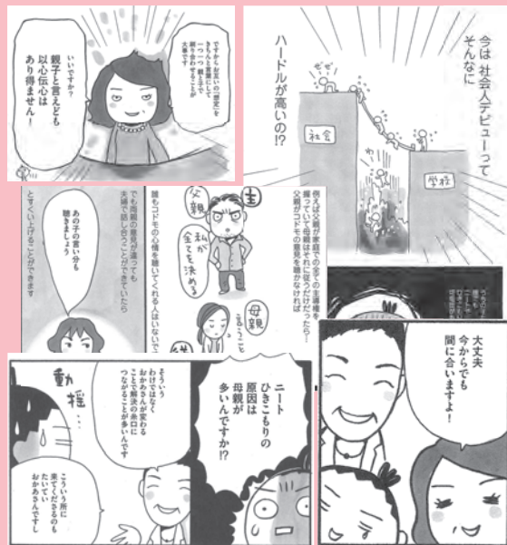
『子どもがひきこもりになりかけたら』(C) 上大岡トメ / KADOKAWA